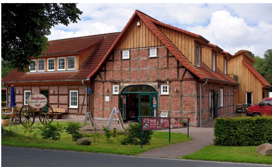
Der Dorfladen im niedersächsischen Otersen wurde 2011 in einem 200 Jahre alten Fachwerkhaus wieder eröffnet. Nun soll eine Energieberatung zeigen, welche Maßnahmen sinnvoll sind.